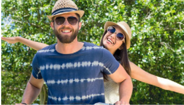
Protégez vos yeux des effets néfastes du soleil.