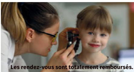
Les rendez-vous sont totalement remboursés.

Ces examens permettent de faire le point sur le développement de l'enfant et de réaliser les vaccinations. Ils peuvent être effectués par un généraliste, un pédiatre libéral, dans un centre de santé et, jusqu'à l'âge de 6 ans, dans un service de protection maternelle infantile (PMI).